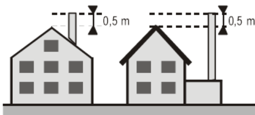
0.50 m au-dessus du faite des toits à deux pans

De manière générale, les émissions de polluants atmosphériques - les fumées ainsi que l'air vicié en font partie - doivent être rejetées verticalement et librement à une hauteur suffisante par-dessus les toits. Concrètement, cela signifie que l'orifice de rejet des émissions doit toujours être situé au-dessus de la partie la plus élevée du toit. Pour les petites installations de chauffage (gaz et mazout de 40 à 350 kW, bois < 70 kW) ainsi que les petites installations artisanales (notamment les ventilations des cuisines de restaurant et de parkings souterrains), il doit dépasser le faite ou la partie la plus élevée de 0.50 m au moins ; s'il s'agit d'un toit plat, l'orifice d'évacuation doit dépasser la surface du toit de 1.50 m au moins (voir schémas ci-dessous). Les chaudières excédant les puissances précitées et les grandes installations artisanales et industrielles sont quant à elles soumises à des dispositions plus détaillées et plus contraignantes.